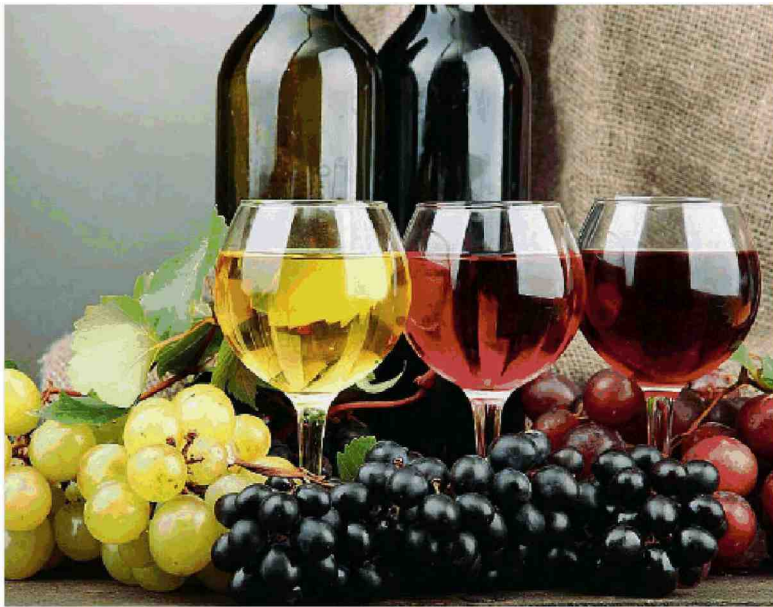
Aumentano i servizi turistici offerti dalle aziende vinicole