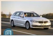
AUTO | 11 maggio 2017 Bmw Serie 5 Touring, ecco la nuova station wagon della casa bavarese