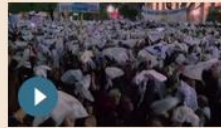
MONDO | 11 maggio 2017 Argentina, bloccata legge su rilascio criminali della dittatura