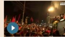
MONDO | 11 maggio 2017 Brasile: Lula interrogato per cinque ore in tribunale