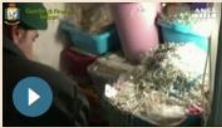
ITALIA | 11 maggio 2017 Bigiotteria pericolosa, sequestrati 1,5 mln di articoli