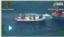
ITALIA | 11 maggio 2017 Omicidio migrante per cappellino, fermato complice