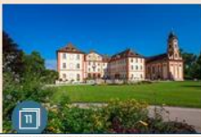
CITY BREAK | 11 maggio 2017 Germania, i nobili giardini di Mainau