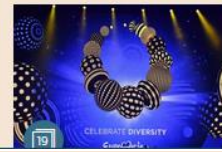
EUROPA | 10 maggio 2017 Eurovision Song Contest, gli artisti in gara nelle semifinali