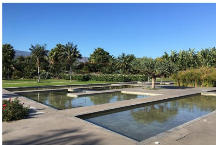
Il parco Radicepura

L'annuale rassegna dei vini siciliani dal 25 al 29 aprile sarà ospite a Catania nell'incantevole cornice del Radicepura Garden Festival.